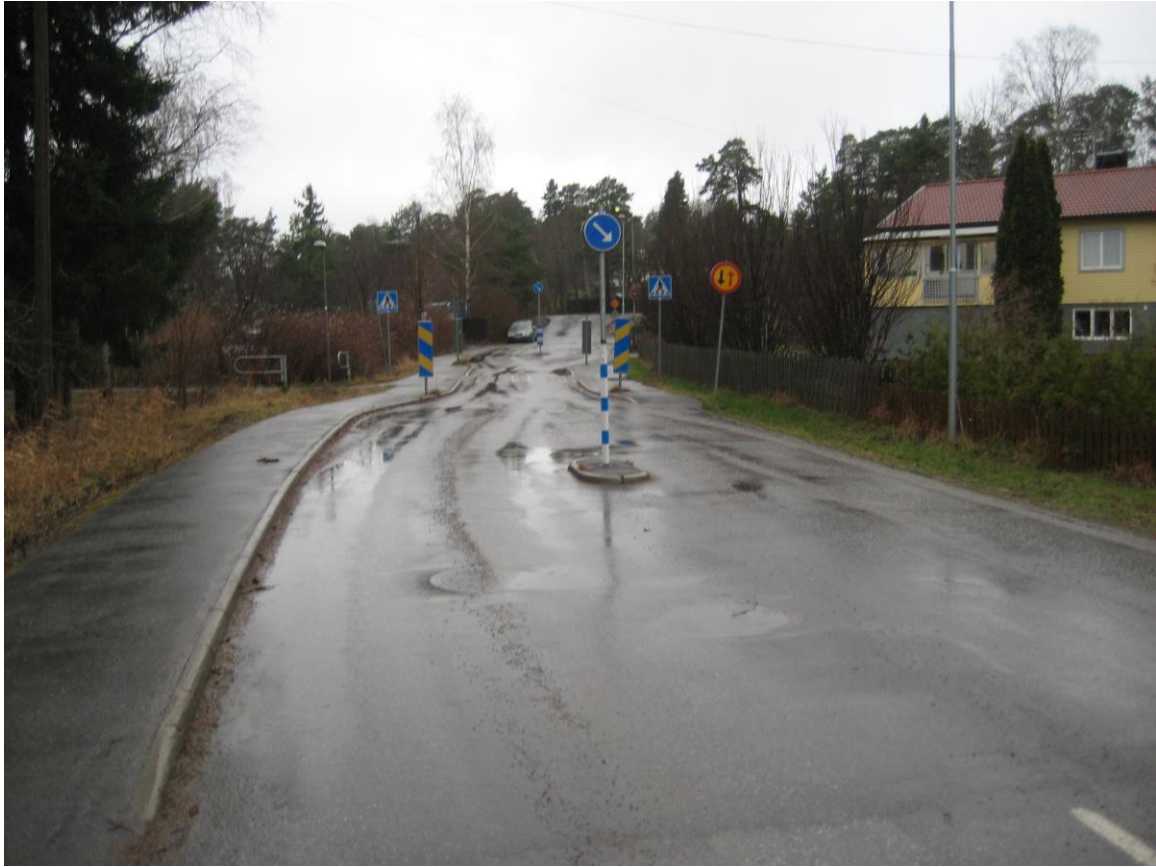
Bilden visar utfart från Hemmesta Dalväg mot Skärgårdsvägen, med fartdämpande åtgärder.